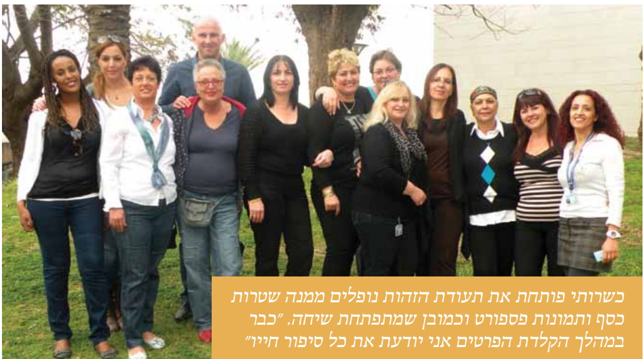
כשרותי פותחת את תעודת הזהות נופלים ממנה שטרות כסף ותמונות פספורט וכמוכן שמתפתחת שיחה. "כבר במהלך הקלדת הפרטים אני יודעת את כל סיפור חייו"

לא כך הוא הדבר. משרד קבלת החולים של בית החולים שלנו מונה 57 (!) אנשים - ליתר דיוק, 56 נשים וגבר אחד - והיקף הפעילות שלו עצום: משרד קבלה של חדר מיון, משרד קבלה שמטפל בקבלת חולים לאשפוז, רישום יילודים, הפקת רישיונות קבורה; בבניין מרפאות חוץ יש דלפק ראשי - וגם הוא שייך, מכון הלב, טיפול יום, מכון גסטרו, נשים וילדים, אא"ג, ריאות, נוירולוגיה,