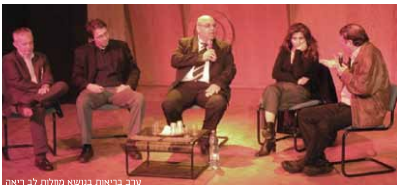
ערב בריאות בנושא מחלות לב ריאה

"בקרוב נתחיל בביצוע מחקר פורץ דרך, שמטרתו למצוא טיפול תרופתי למחלת האלצהיימר; לא טיפול בסימפטומים של המחלה, כפי שהיה נהוג עד היום, אלא טיפול במחלה עצמה, במטרה להפסיק אותה לחלוטין". כך אמר פרופ' יאיר למפל, מנהל מחלקת הניורולוגיה בוולפסון, בערב בריאות של המרכז הרפואי שנערך בהיכל התרבות בבת ים בהנחיית העיתונאי איתן דנציג. פרופ' למפל הסביר לקהל כי מחלת האלצהיימר הינה המגיפה של העשורים הבאים, שכן התחזיות הן כי עד שנת 2030 שיעור הסובלים מהמחלה יזנק עד פי 4 ביחס להיום. "שתי הסיבות העיקריות לכך הן הזדקנות האוכלוסייה מחד, והנטייה לאמץ פחות ופחות את המוח מאידך", הסביר פרופ' למפל. "היום אנשים נעזרים יותר ויותר במחשבים, בתכנות ניווט, אפליקציות ועוד, דבר שלא מאפשר להם להפעיל את המוח כפי שנהגו בעבר". בערב הבריאות בבת ים השתתפו גם פרופ'