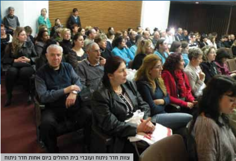
צוות חדר ניתוח ועובדי בית החולים ביום אחות חדר ניתוח