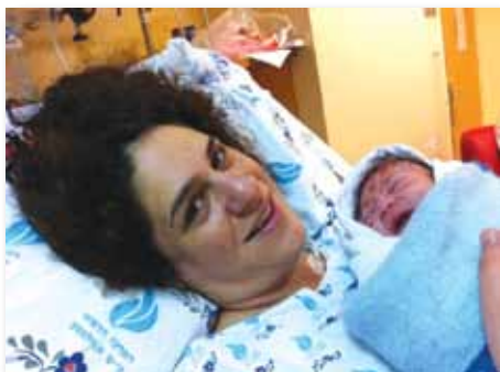
"תוכנית הבוקר", ערוץ 10, 1.1.12