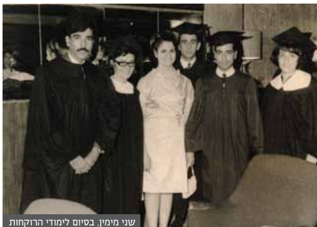
שני מימין, בסיום לימודי הרוקחות

"יהודים היו תחת מעקב מתמיד. חלקם נעלמו ללא עקבות כמו אבא של גיסתי. היינו מקשיבים במחלת לקול ישראל. זה היה כמו המשטר הנאצי, רק בעיראקית"