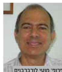
פרופ' מוטי לורברבוים