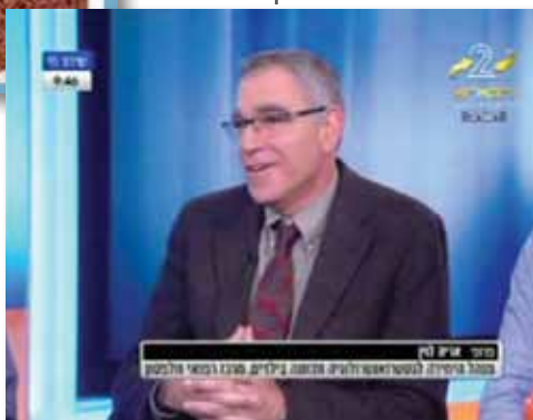
"לחיות טוב", ערוץ 2, 12.1.12